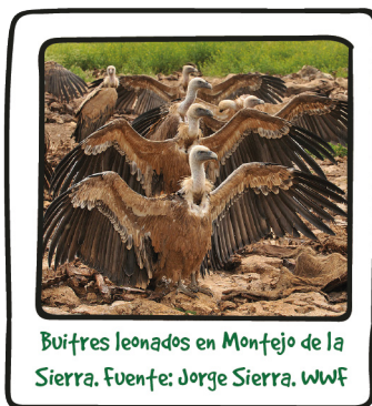
Buitres leonados en Montejo de la Sierra.

En España, aunque la primera experiencia fue llevada a cabo por Félix Rodríguez de la Fuente en 1975, con la creación del Refugio de Rapaces de Montejo de la Vega (Segovia); no es hasta el año 2000 que se formaliza el concepto y el movimiento de la Custodia del Territorio con la firma de la Declaración de Montesquieu. Podemos decir, por tanto, que se trata de una herramienta muy joven que ha ido creciendo en importancia y peso para las administraciones desde entonces.